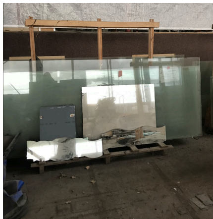
Verre feuilleté sans menuiserie